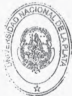
Arq. GUSTAVO ADOLFO AZPAZU Presidente de la Universidad Nacional de La Plata